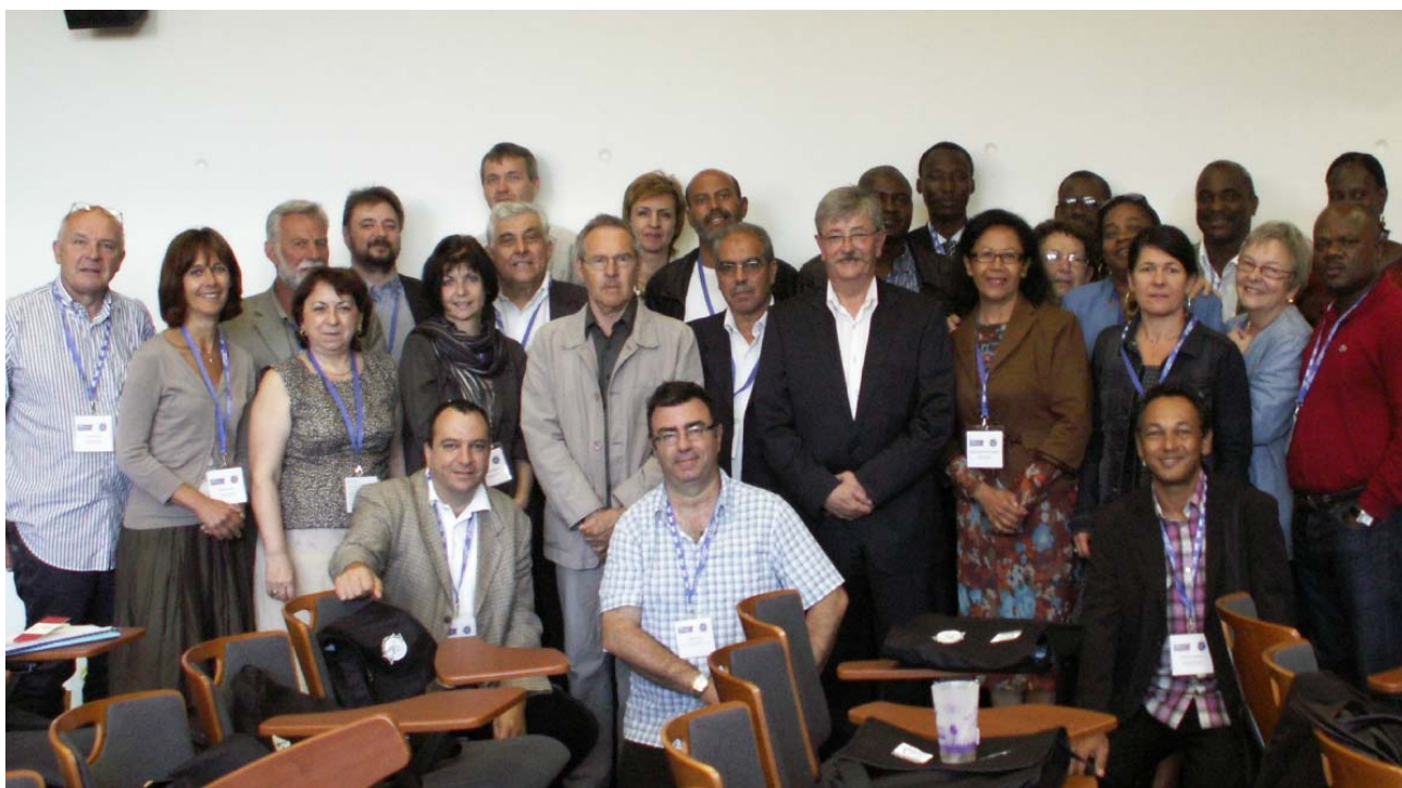
Les représentants des associations membres de la Ligue Internationale de l'Enseignement, de l'Éducation et de la Culture Populaire le 24 juin 2010.